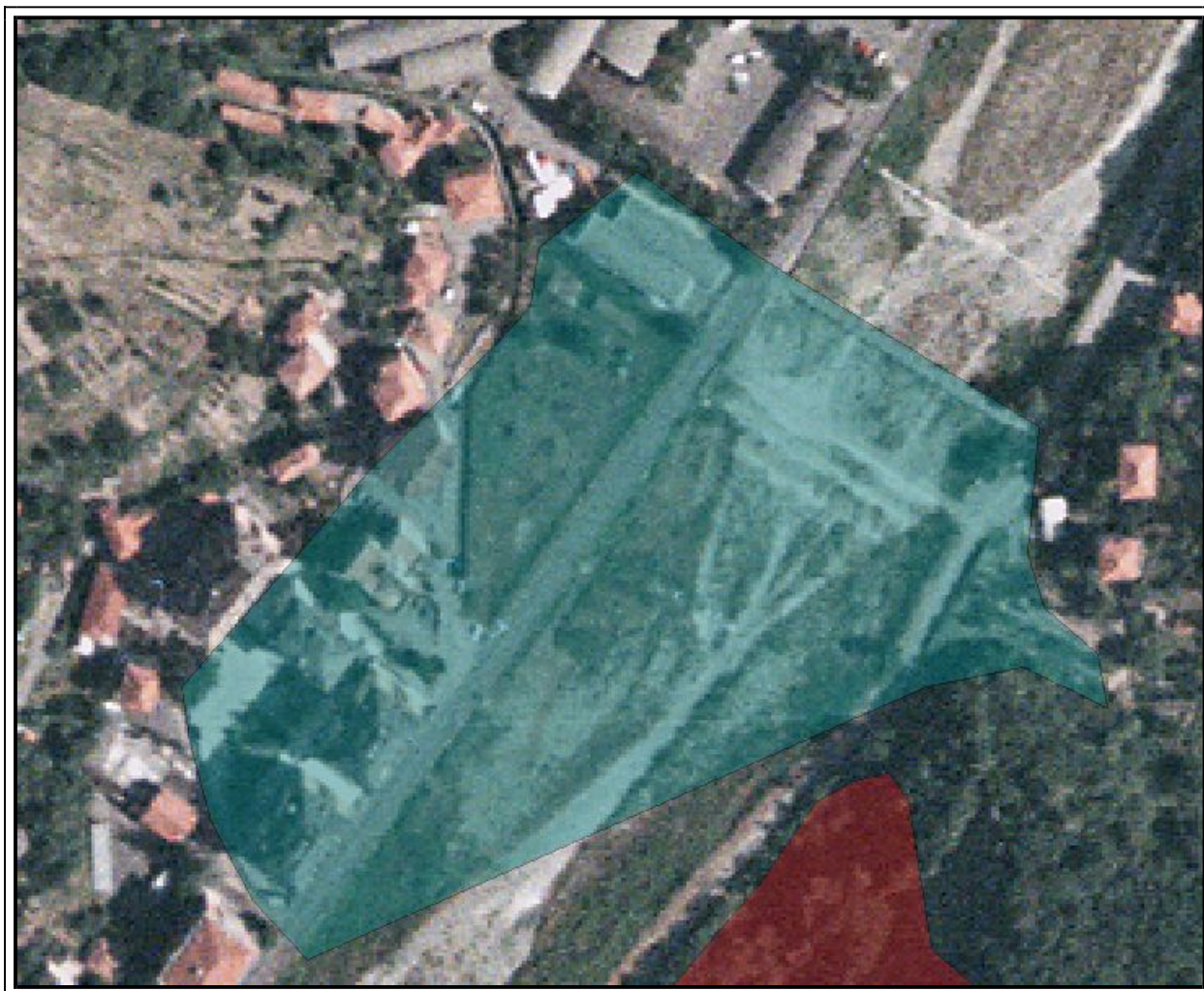
Rappresentazione dell'area di rischio riportata sul terreno tramite foto satellitare.