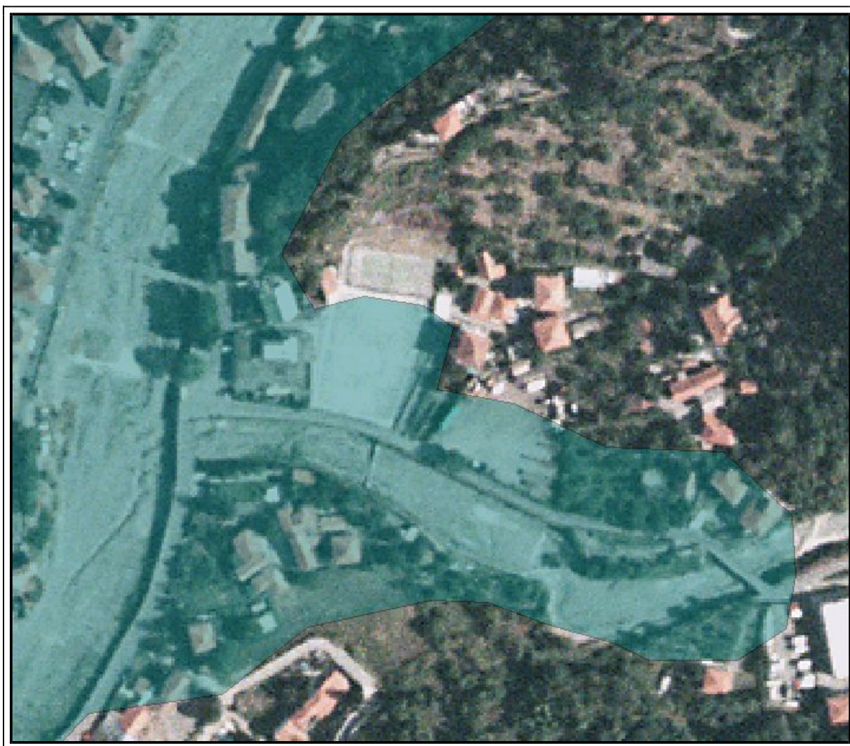
Rappresentazione dell'area di rischio riportata sul terreno tramite foto satellitare.