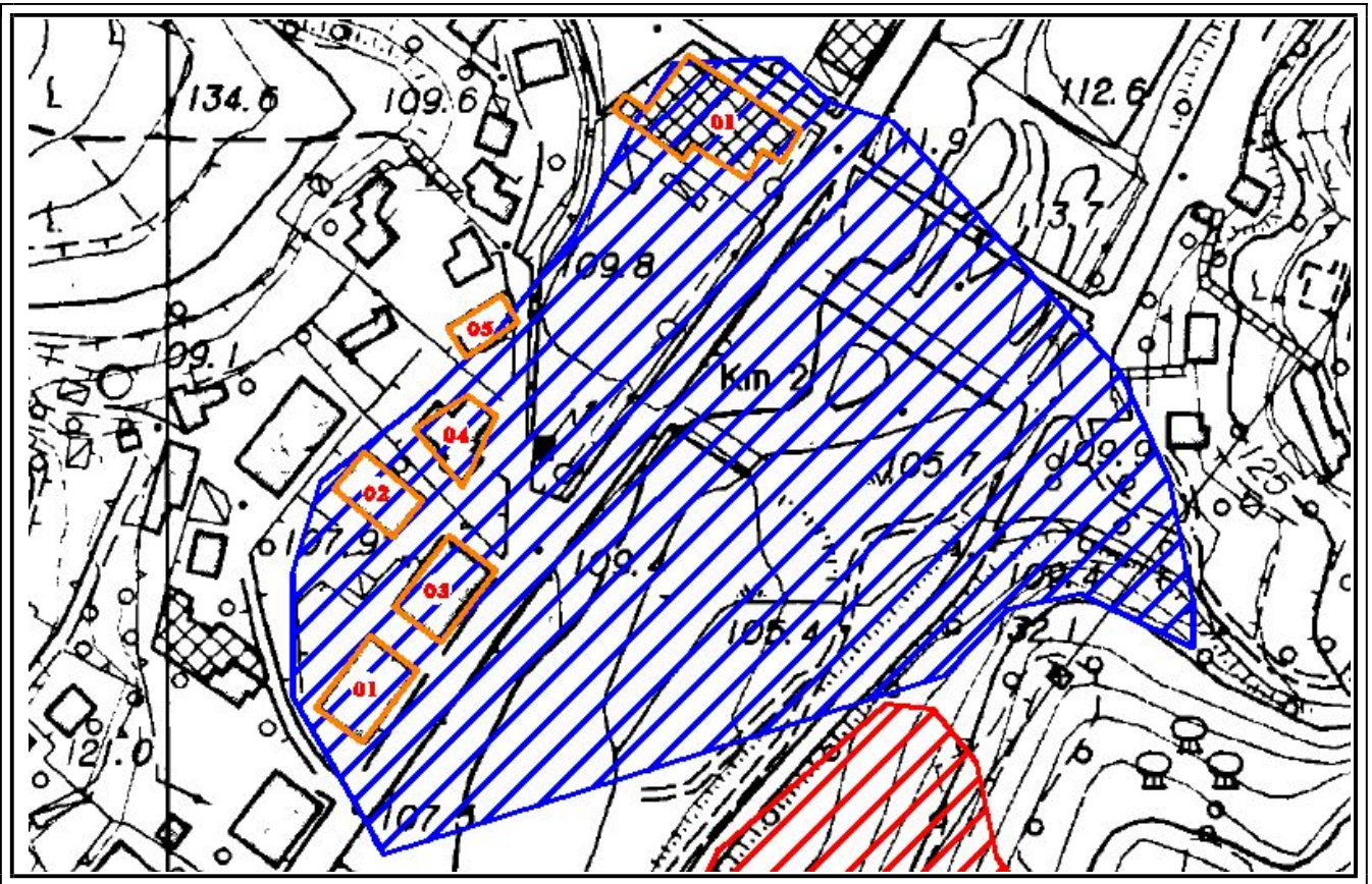
Trasposizione dell'area di rischio sulla carta tecnica regionale a maggior dettaglio.

Piccola area in sponda orografica destra del Torrente Secca, nei pressi della confluenza con il Rivo Rocca Chiesa e del ponte che collega alla Località Negrotto, Case a Valle. Sono presenti attività industriali e artigianali rilevanti ed alcuni edifici ad uso abitativo . E' presente la viabilità principale di collegamento sponda destra del Torrente Secca . Sono coinvolti anche brevi tratti di viabilità secondarie. La zona ha estensione limitata ma riporta un livello di rischio "molto elevato" . Lungo il Torrente Secca sono indicate altre limitate zone di rischio minore che non risultano interessare manufatti se non i muri d'argine o altre infrastrutture di particolare interesse.